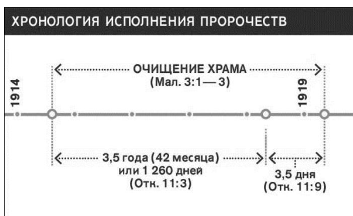
Рис. 2. Хронология исполнения пророчеств свидетелей Иеговы (по «Сторожевой башне») 550

самоочевидный 549 , а значит, и не нуждающийся в доказательствах. Исторически значение этой даты понятно. В 1918 г. преемник Расселла Рутерфорд и несколько его сподвижников были заключены в тюрьму за нарушение законов США о шпионаже (отсюда первоначальная идея о начале проверки в этом году), а через девять месяцев, в марте 1919 г. досрочно выпущены. Однако в Писании нет нужных промежутков в 4-5 дней/лет. Поэтому свидетели Иеговы в статье 2014 г. приводят схему «хронологии исполнения пророчеств», призванную затушевать этот пробел.